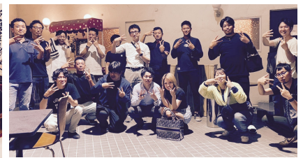
左・四馬路にて地域研修、対外交流、財務研修委員会 /右・カラオケバンダイみくもにて総務広報、地域交流、会員力向上委員会

7月21日(金)テーマ:グルメ×ゲーム×合コン！松阪YEGメンバーとの飲食イベントで楽しみながら絆を深めよう！より2会場で開催されました。