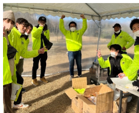
アンケートはこちら